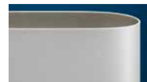
Ropanyl Premium Plus Belt

Résultats des essais d'effilochage/ fiabilité obtenus lors d'essais identiques en laboratoire: