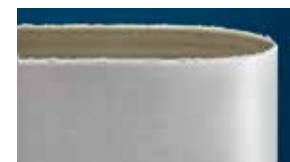
Bande équivalente des principaux concurrents